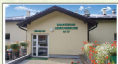
Sanatorium Nr IV