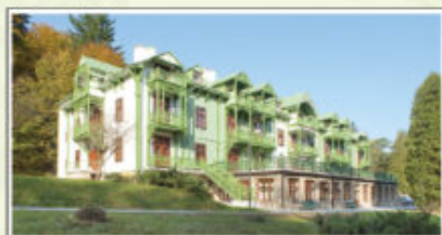
Sanatorium „Biały Orzeł”