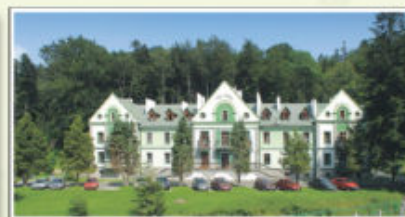
Sanatorium „Pod Jodłą”