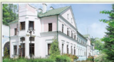
Sanatorium „Stare Łazienki”