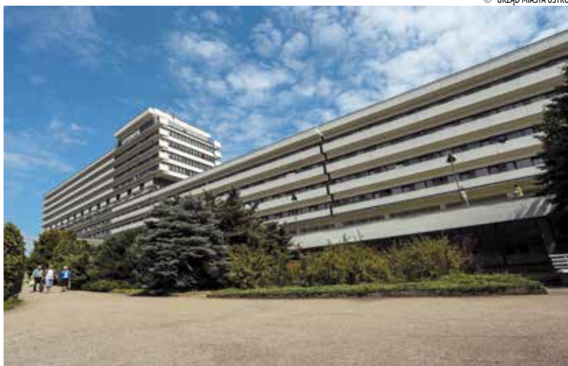
▼ Sanatorium i Szpital Uzdrowiskowy Równica w Ustroniu-Zawodziu

ny Żatuskich, którzy postanowili rozbudować miejscowość. Z ich inicjatywy powstało wiele zachowanych do dziś obiektów. W zabytkowym Starym Pałacu, wzniesionym w pierwszej połowie XIX stulecia, niegdyś letniej rezydencji dawnych właścicieli tutejszych ziem, funkcjonuje dziś siedziba zarządu Uzdrawiska Iwonicz S.A. Z tego okresu pochodzi też stojący niedaleko pawilon Nad Źródłami. Uwagę przechodniów zwraca drewniany Dom Zdrojowy z werandą zdobioną mauretańskimi łukami. W jego pobliżu stoi dawny pensjonat Bazar wyróżniający się wieżą z krytym tarasem widokowym i zegarem. Na wschód stąd znajduje się zbudowana na zlecenie Żatuskich w 1895 r. kaplica, obecnie Kościół św. Iwona i Matki Bożej Uzdrawienia Chorych. Aby skorzystać z dobroczynnego wpływu miejscowych źródeł, należy udać się do Pijalni Wód Mineralnych sąsiadującej z sanatorium Stare Łazienki. W okolicy są dwa dawne pensjonaty (dziś obiekty sanatoryjne): Pod Jodłą i Biały Orzeł. Ten drugi obiekt pochodzi z 1912 r. i został zaprojektowany w stylu szwajcarskim. Jego największą ozdobę stanowią liczne drewniane balkony.