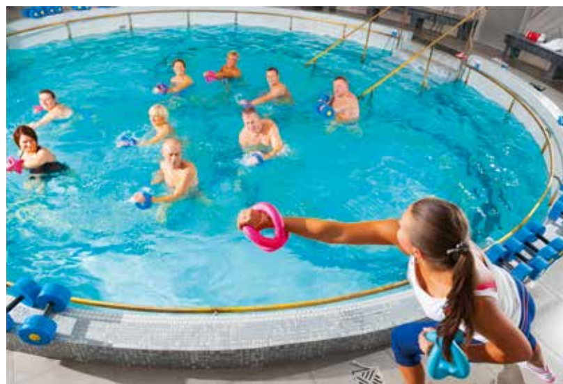
▲ Zajęcia aquafitness w basenie w Uzdrowskim SPA „Marysieńka” w Cieplicach

fasada budynku ma ponad 80 m długości. W gmachu działa dzisiaj filia Politechniki Wrocławskiej. Do rodziny Schaffgotschów