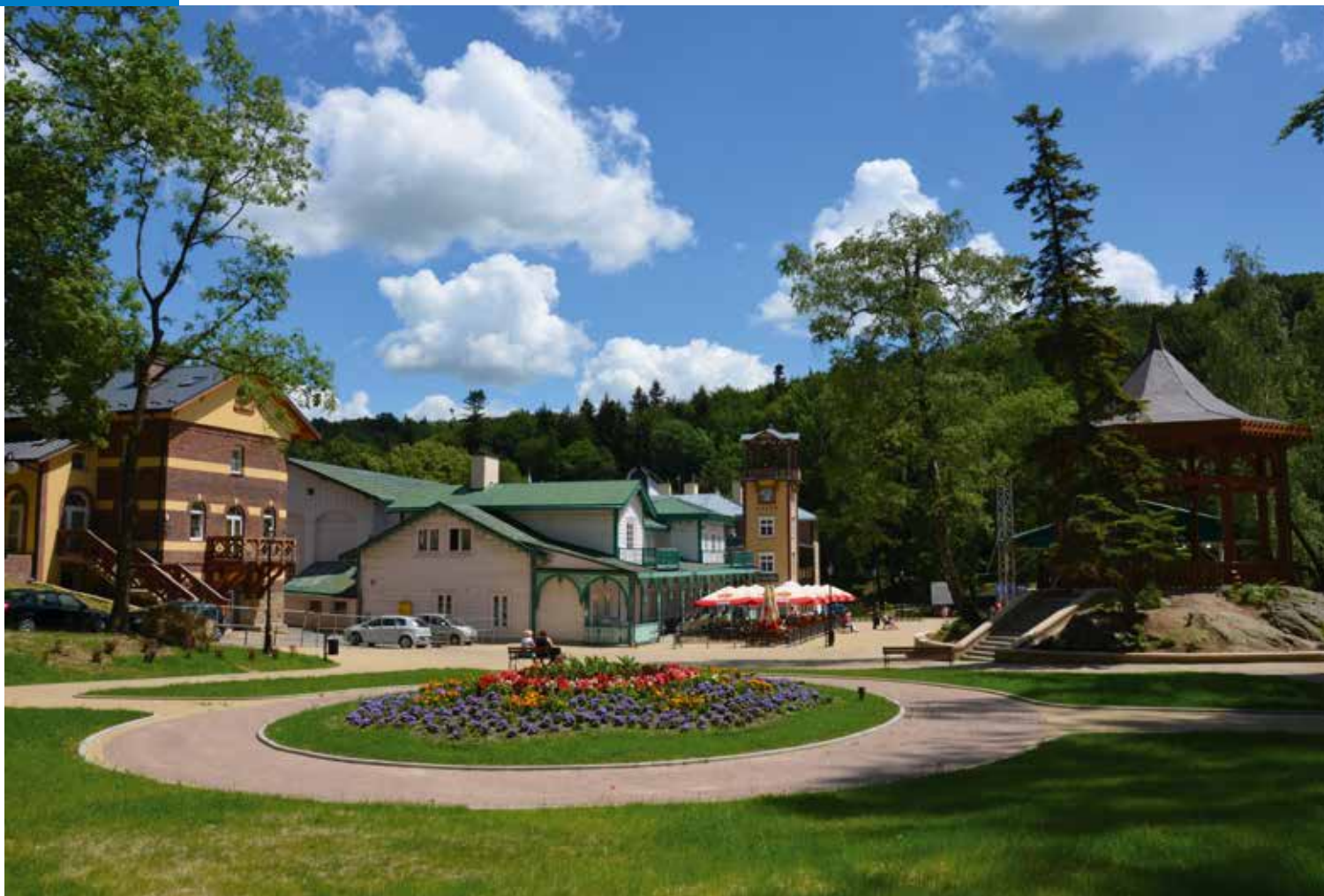
▲ Centrum Iwonicza-Zdroju – w oddali drewniany Dom Zdrojowy i wieża Bazaru

Wiele miejscowości uzdrowiskowych leży na południu Polski. We wschodnim rejonie tej części kraju, w województwie podkarpackim znajduje się Iwonicz-Zdrój. Należy on do najstarszych polskich uzdrowisk. Swoją rolę zawdzięcza miejscowym źródłom wód mineralnych, o których wspominał już w traktacie o leczeniu balneo-