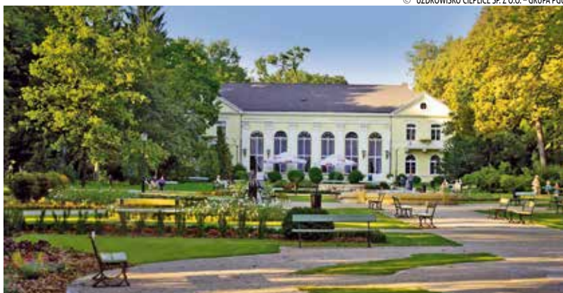
▼ Pawilon Edward w Parku Zdrojowym w centrum cieplickiego uzdrowiska

pozostaje trwałą ruiną. W pobliżu wspomnianego pałacu znajduje się pocysterski zespół klasztorny z Muzeum Przyrodniczym i Kościół św. Jana Chrzciciela. Wnętrze świątyni i zdobienia utrzymane są w stylu barokowym i rokoko. Na dziedzińcu oglądać można tablice nagrobne rodu Schaffgotschów. Przy placu Piastowskim wznosi się XVIII-wieczny kościół ewangelicko-augsburski, stanowiący jedną z najcenniejszych budowli protestanckich doby baroku na Śląsku. Na terenie Parku Zdrojowego, utrzymanego w stylu angielskim, znajduje się Pawilon Edward z zabytkową jadalnią, Zdrojowy Teatr Animacji (z XIX stulecia) i muszla koncertowa. Po drugiej stronie rzeki Wrzosówki leży malowniczy Park Norweski. Jego nazwa pochodzi od usytuowanego tu drewnianego Pawilonu Norweskiego, który został zbudowany w 1909 r. na podobieństwo jednej z restauracji w Oslo w Norwegii.